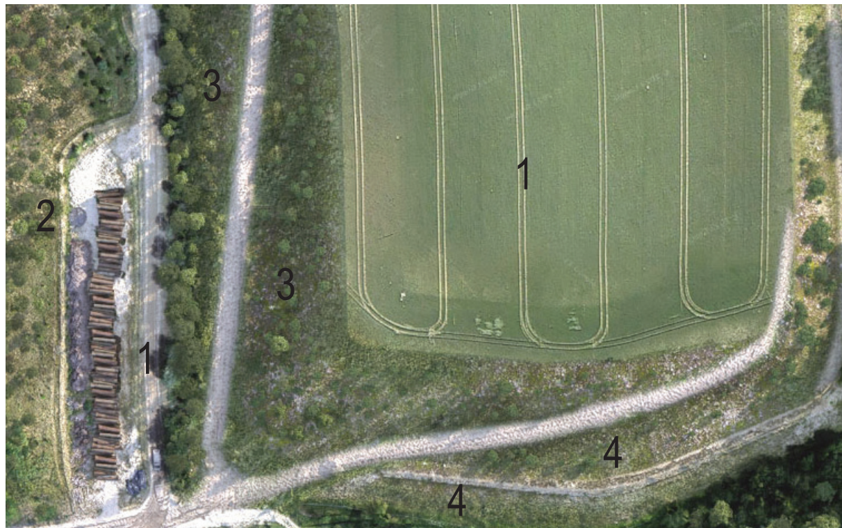
Origan (Pelouses marno-calcaires)

Remise en place d'un habitat de pelouses sur sables et de pelouses marno-calcaires comportant des cortèges d'espèces végétales patrimoniales (Mibore Naine) et disposant d'enrochements gréseux du site afin de constituer des gîtes et pierriers favorables à la Biodiversité.